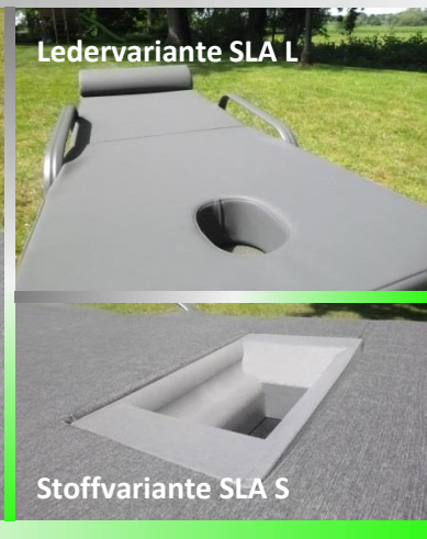
Ledervariante SLA L